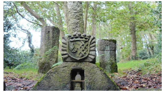
Fontaine Saint Ergat

Un parcours sportif et historique entre Saint Renan, Lanrivour et Tréouergat.