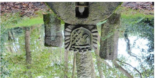
Circuit n°6 - Saint Renan