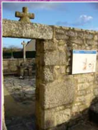
Le Cimetière des Saints

Le calvaire du cimetière, construit au XVIII ème siècle, a été inscrit à l'inventaire des Monuments historiques en 1930.