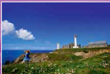
La pointe Saint-Mathieu

A visiter : le phare, le musée, l'abbaye et le cénotaphe.