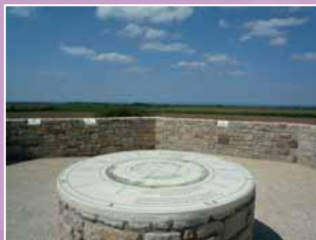
Le belvédère de Kéramézec

Ports d'embarquement pour Molène et Ouessant : Le Conquet, Brest et Lanildut l'été.