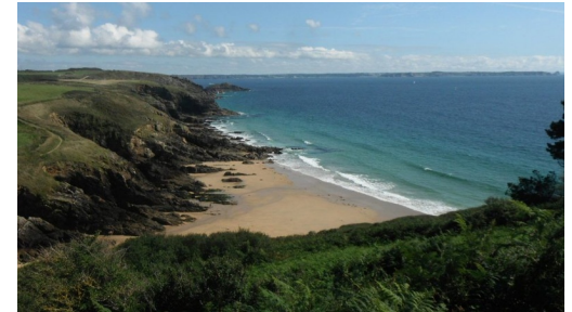
Grève de Deolen

Ce circuit VTT rejoint la côte de Locmaria-Plouzane et sa succession de plages, de falaises et de grèves vous offrant une vue splendide sur la presqu'île de Crozon et les Tas de Pois.