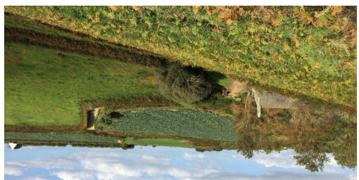
Circuit n°1 - Ploumoguier