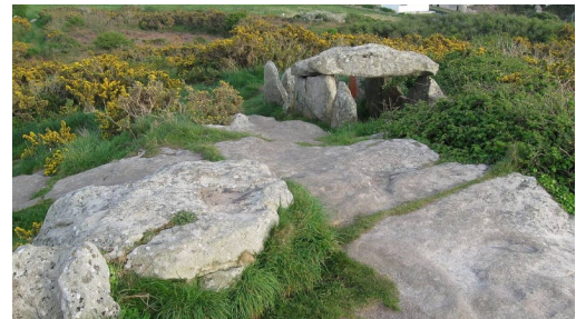
L'allée couverte de Guilliguy

Ce circuit passe à la Pointe du Guilligui et traverse la ville de Portsall avant de s'éloigner sur les chemins de la commune de Ploudalmézeau.