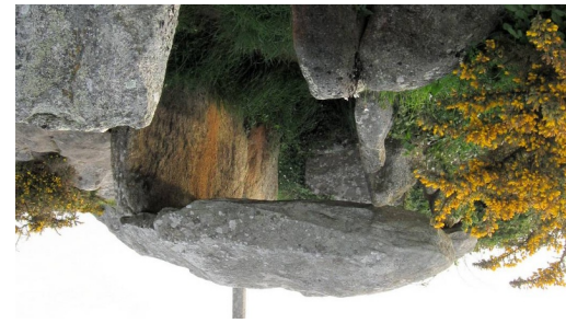
L'allée couverte de Guilliguy et la Croix