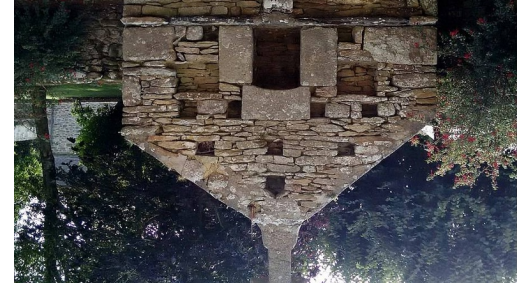
Ossuaire de la Chapelle de Kersaint

Ce circuit VTT démarre de la chapelle de Kersaint et rayonne sur les chemins et petites routes de la commune de Landunvez.