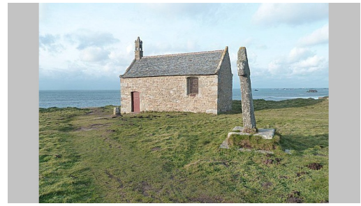
Chapelle Saint Samson Photo: © patrimoine-iroise.fr

Image de couverture: Chapelle Saint Samson Données cartographiques: Cartographie d'Outdooractive: ©OpenStreetMap Photo: © patrimoine-iroise.fr