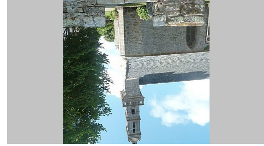
Chapelle de Kersaint