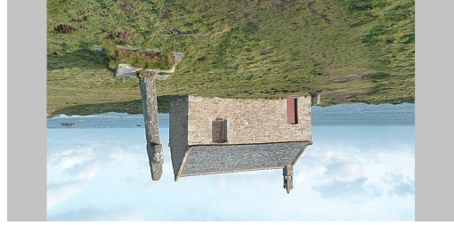
Circuit n°10 – Landunvez