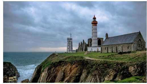
Pointe de Saint-Mathieu

Voici un long circuit pour cycliste plutôt sportif permettant de faire une grande boucle à travers les communes de Plougonvelin, le Conquet, Ploumoguier et Locmaria-Plouzané.