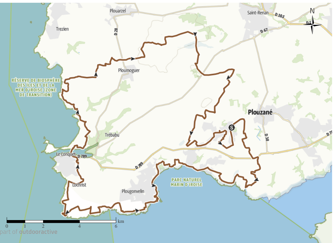
Image de couverture: Pointe de Saint-Mathieu Données cartographiques: ©OpenStreetMap (www.openstreetmap.org)

Scannez le code QR et sauvegardez la randonnée hors-ligne, la partager avec des amis et bien plus encore ... Site web http://www.mountpass.com/s/Cued4